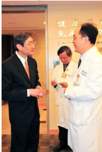
【李院長介紹附醫乳房管理中心】