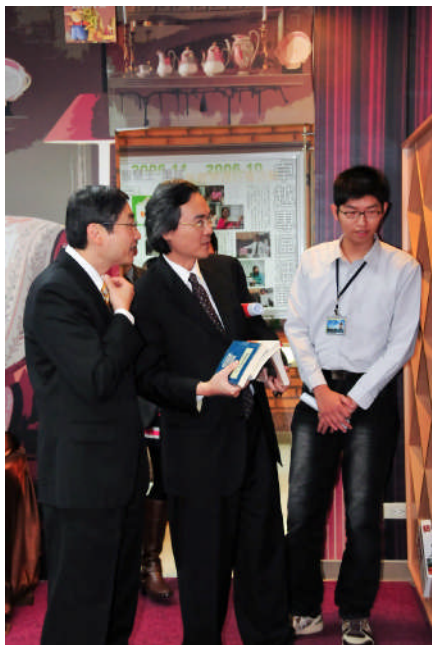
【參觀圖書館-100 好書推薦】