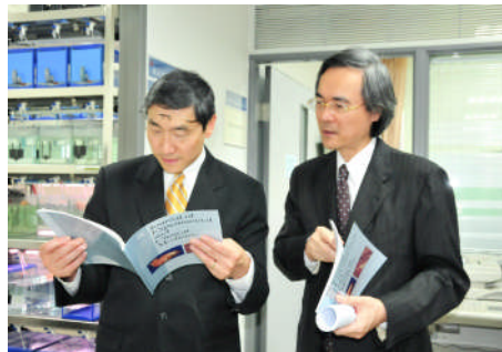
【曾院長介紹本校期刊 JECM】