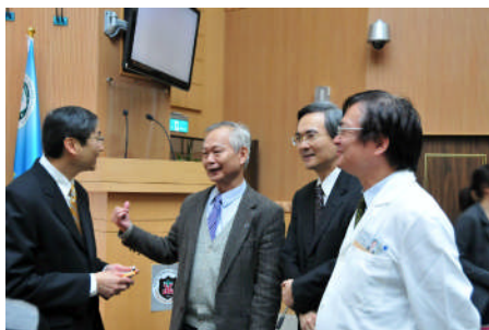
【會後與閩狀卿老師討論】