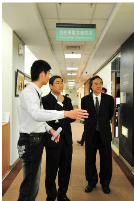
【參觀圖書館-自主學習共同空間】