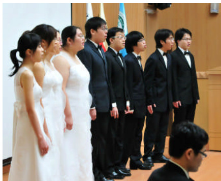
【杏聲合唱團為來賓獻唱月亮代表我的心】