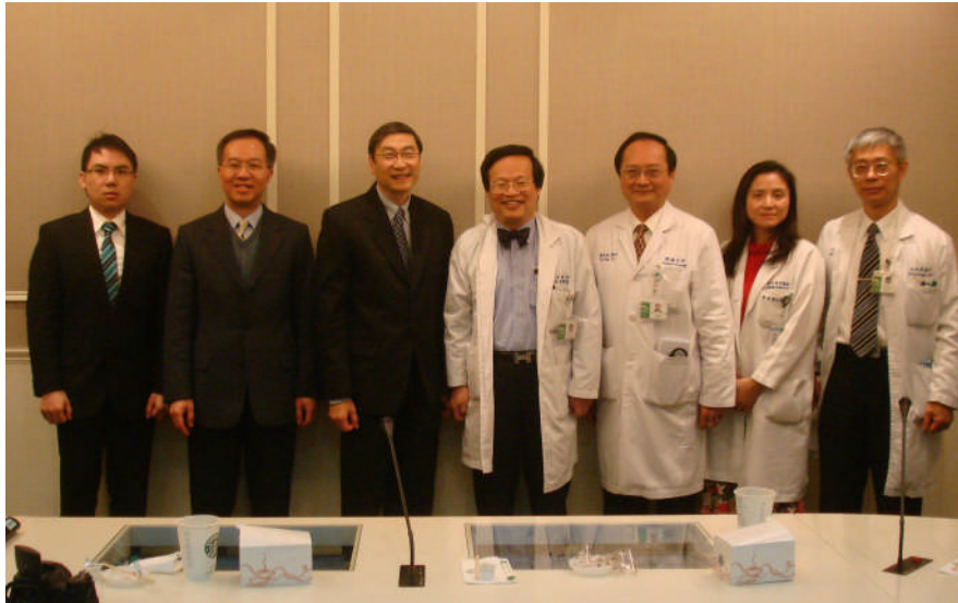
【與萬芳醫院同仁合影】