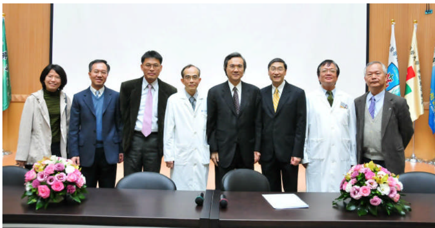
【Dean Wong 與本校教師於演講會場合影】